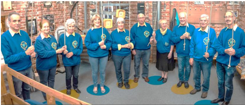
Wisselluidersgilde in de luidruimte aan de touwen

Meer informatie vindt u op www.wisselluidersgildegeldrop.nl